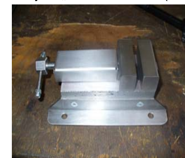
Hier: Projekt „Schraubstock“ (Gewindeschneiden, reiben, senken, meißeln etc.)